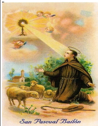
San Pascual Bailón