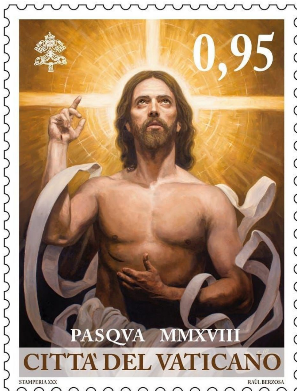
Lienzo "Cristo Resucitado" del artista español Raúl Berzosa.