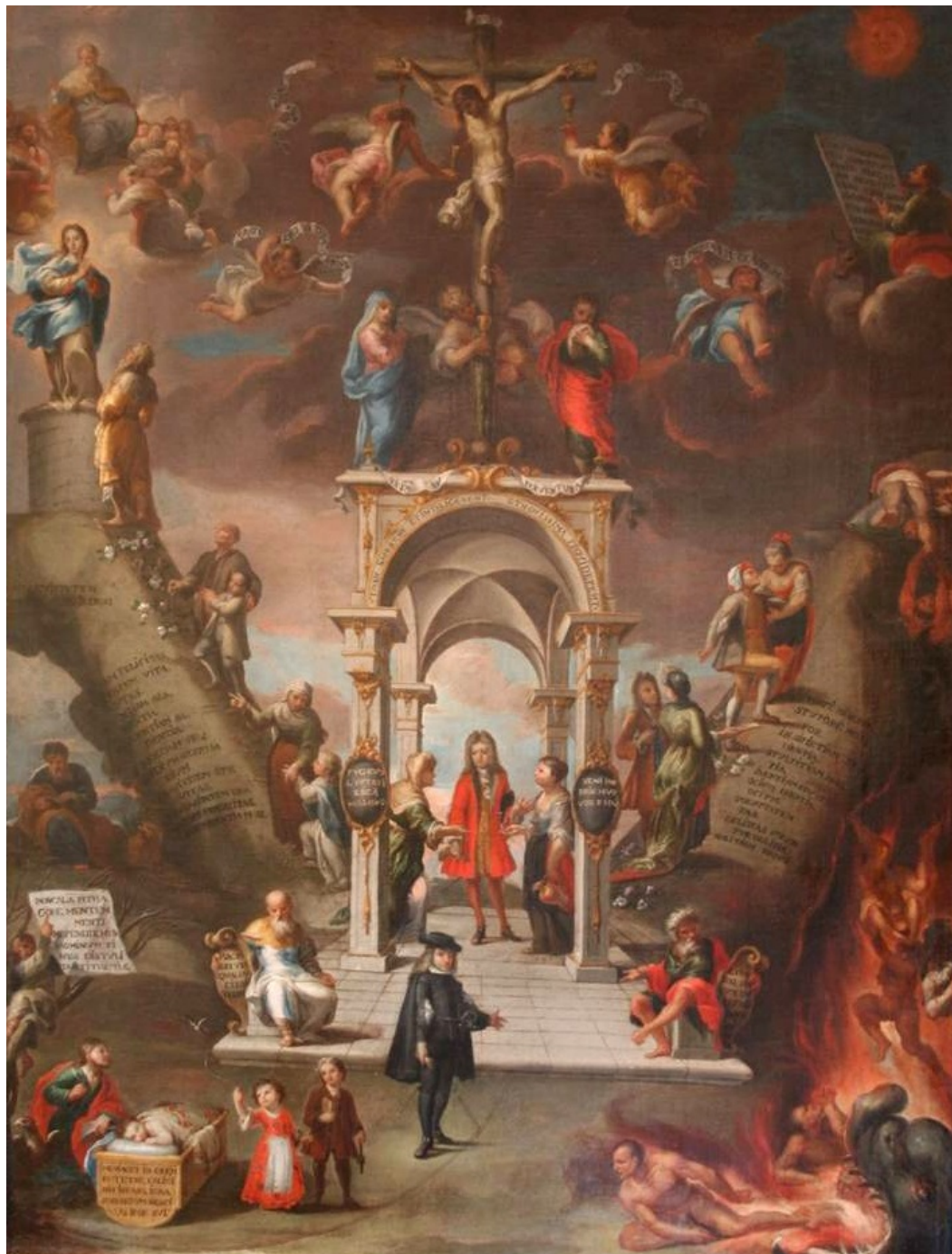
Alegoría de los caminos de la salvación y de la perdición ANÓNIMO (¿Escuela madrileña?)