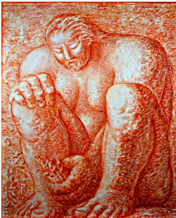
Mujer sentada RAMIRO TAPIA 1989 190 x 153 cm