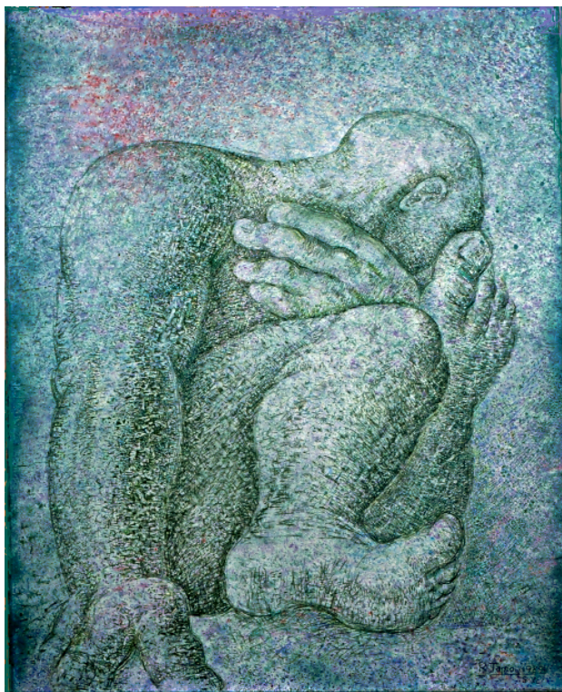
Personaje verde RAMIRO TAPIA 1989 190 x 153 cm