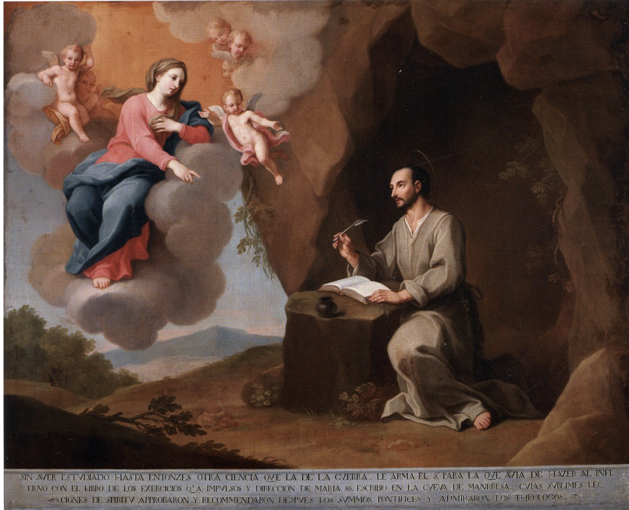
San Ignacio escribiendo el Libro de los ejercicios espirituales SEBASTIANO CONCA Siglo XVIII Óleo sobre lienzo Claustro de estudios Universidad Pontificia de Salamanca