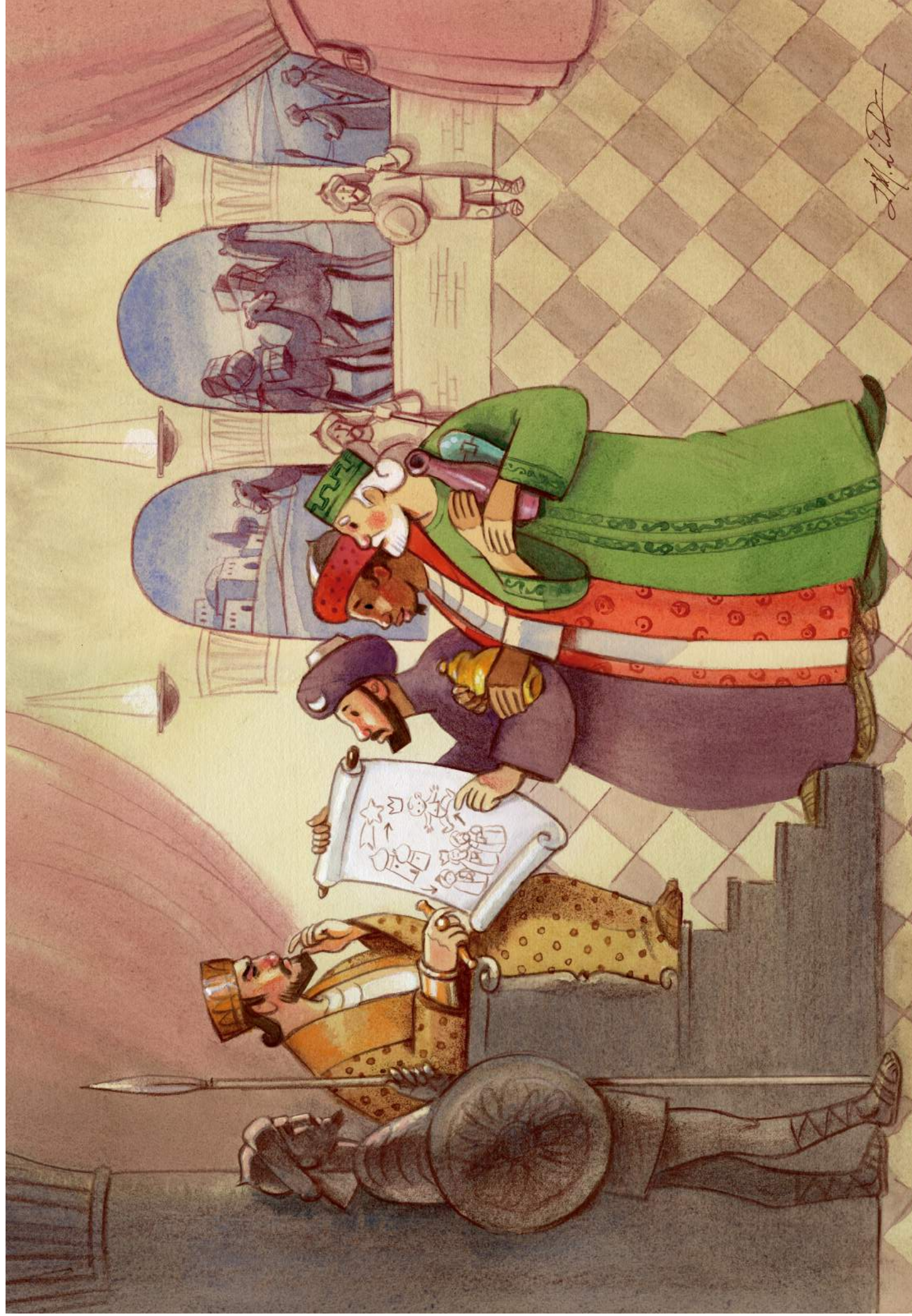
LOS MAGOS, ANTE HERODES- Jose Miguel de la Peña para OMP