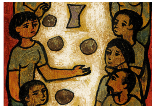
Ilustración: M. CEREZO

• Domingo, día 21. ORACIÓN ante el sepulcro de Santa Teresa de Jesús , en la iglesia del Monasterio de la Anunciación de Nuestra Señora de las Madres Carmelitas Descalzas, en Alba de Tormes.