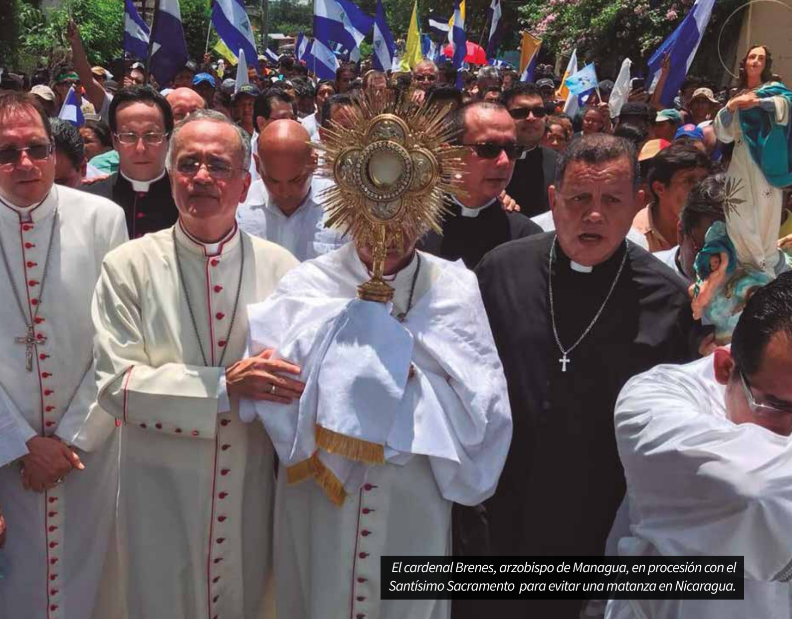
El cardenal Brenes, arzobispo de Managua, en procesión con el Santísimo Sacramento para evitar una matanza en Nicaragua.