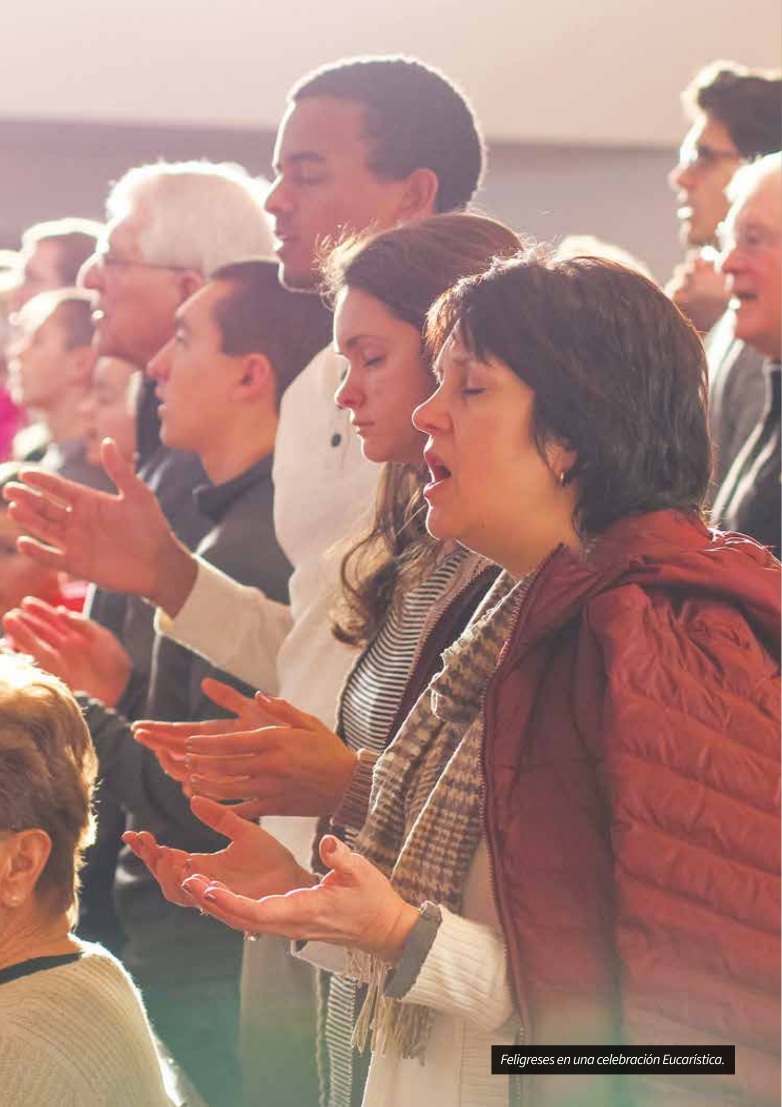
Feligreses en una celebración Eucarística.