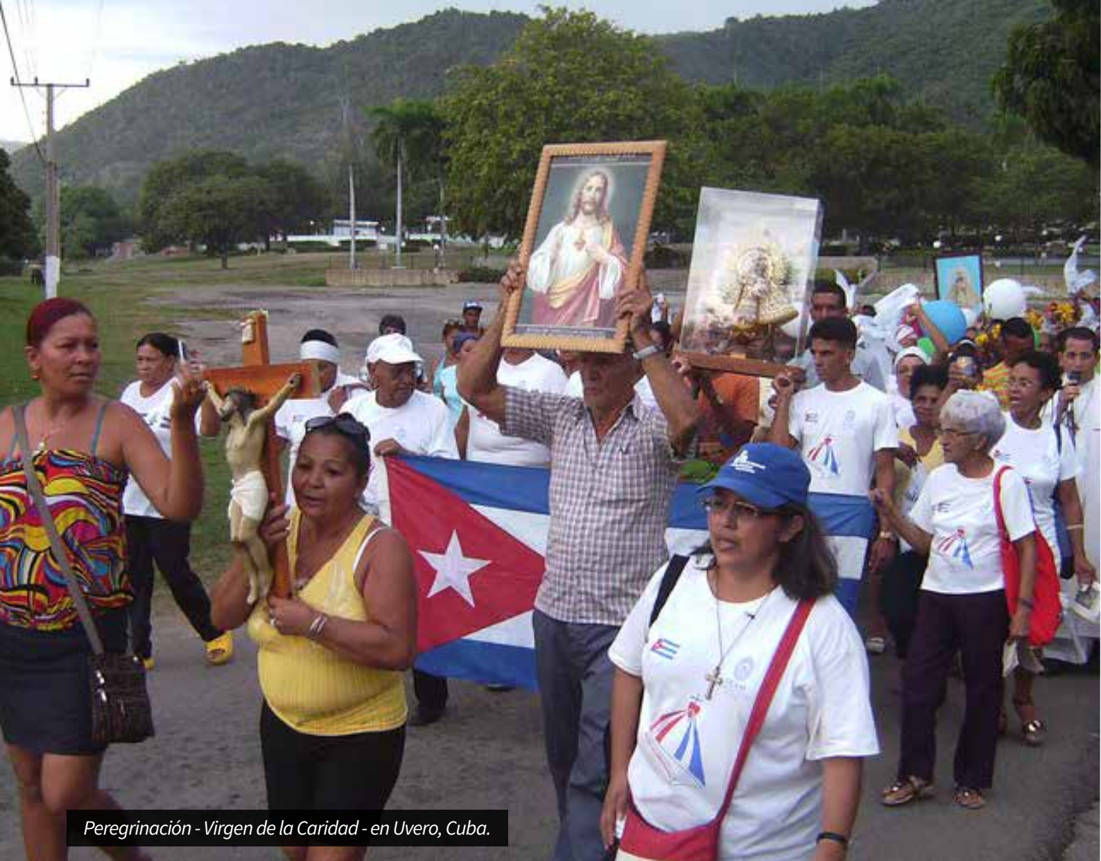
Peregrinación - Virgen de la Caridad - en Uvero, Cuba.