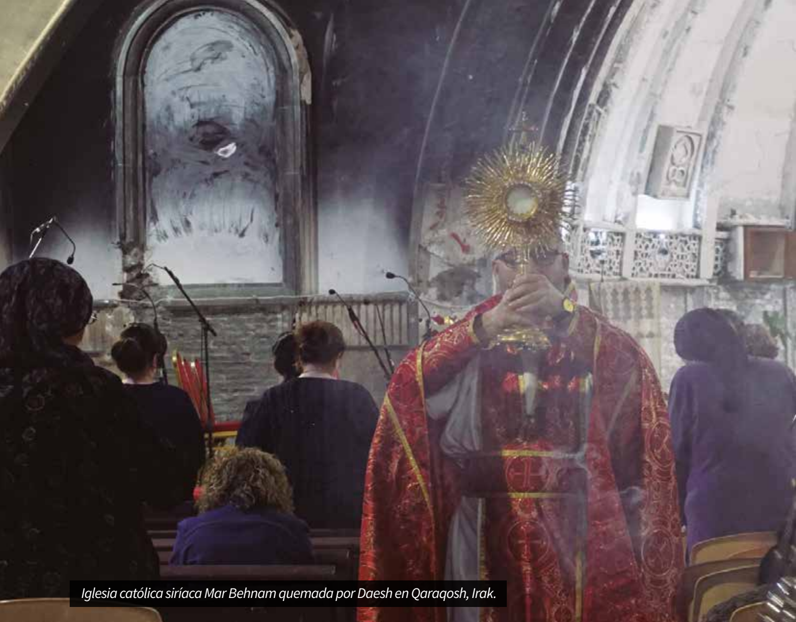
Iglesia católica siríaca Mar Behnam quemada por Daesh en Qaraqosh, Irak.