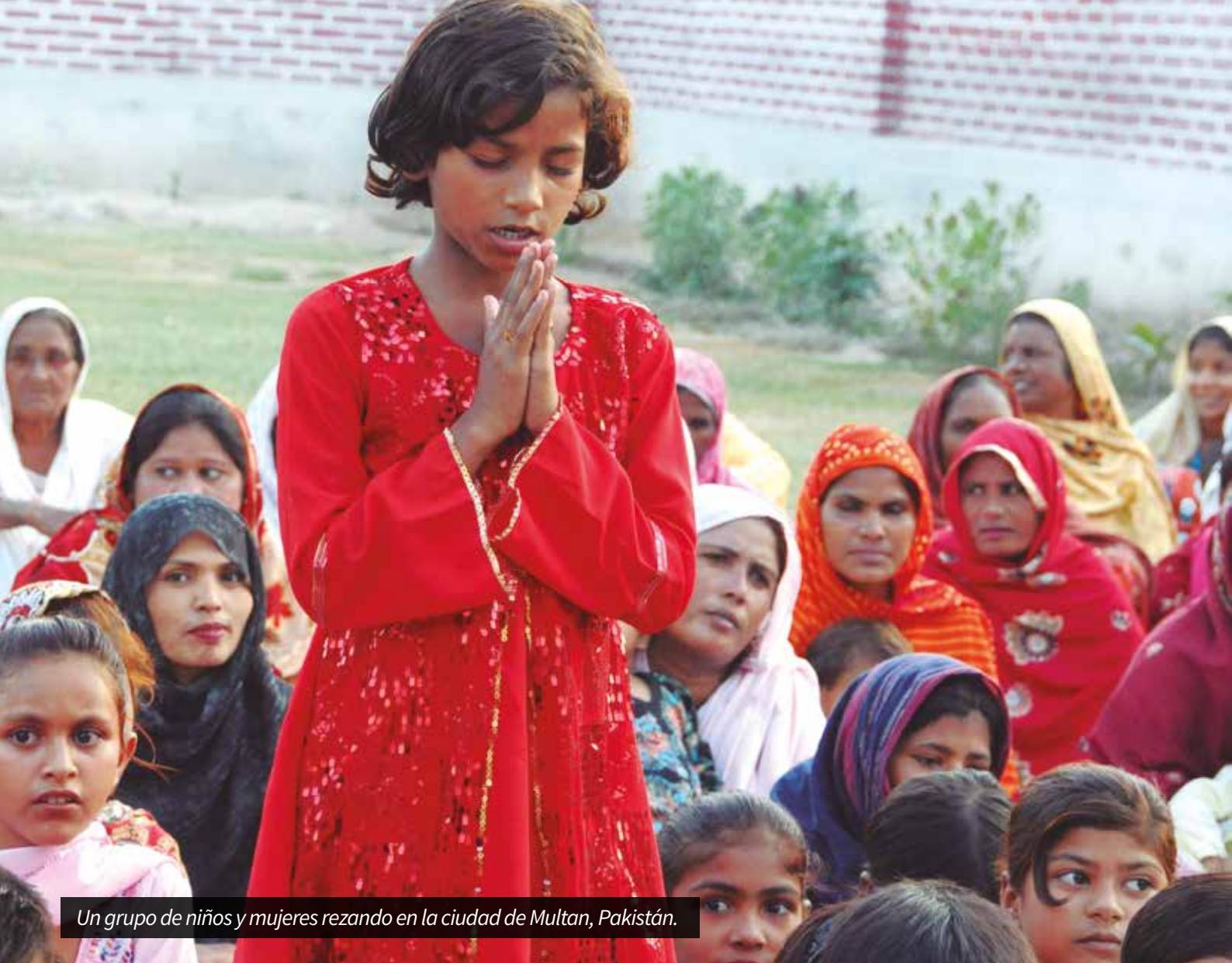
Un grupo de niños y mujeres rezando en la ciudad de Multan, Pakistán.