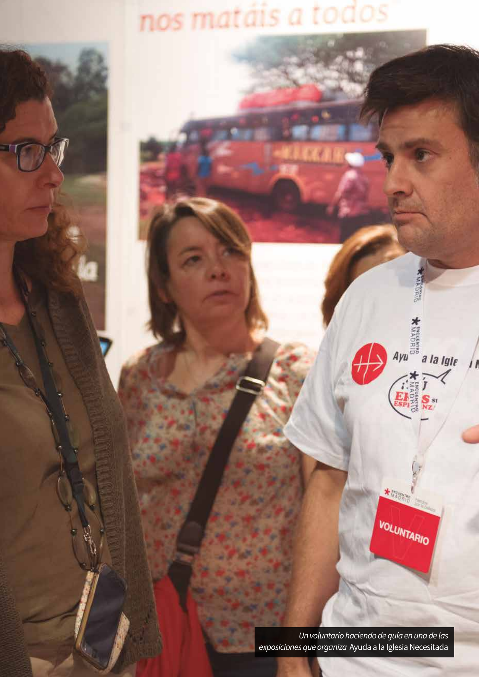
Un voluntario haciendo de guía en una de las exposiciones que organiza Ayuda a la Iglesia Necesitada