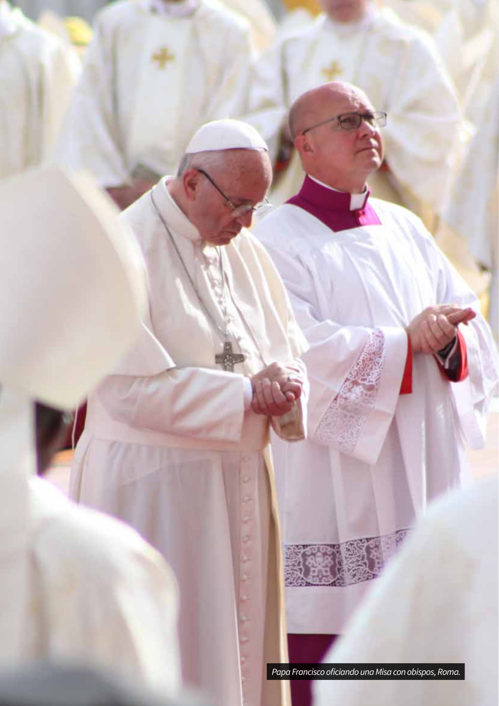
Papa Francisco oficiando una Misa con obispos, Roma.