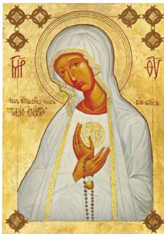
Icono de la Virgen de Fátima.

Pues no me ocultas nada, tu fuego es tu señal, el faro que me indica tu mirada.