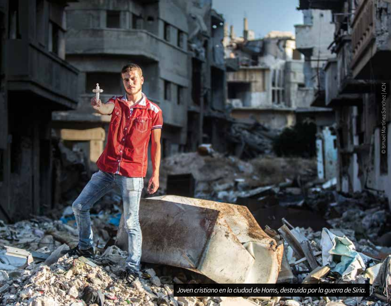
Joven cristiano en la ciudad de Homs, destruida por la guerra de Siria.