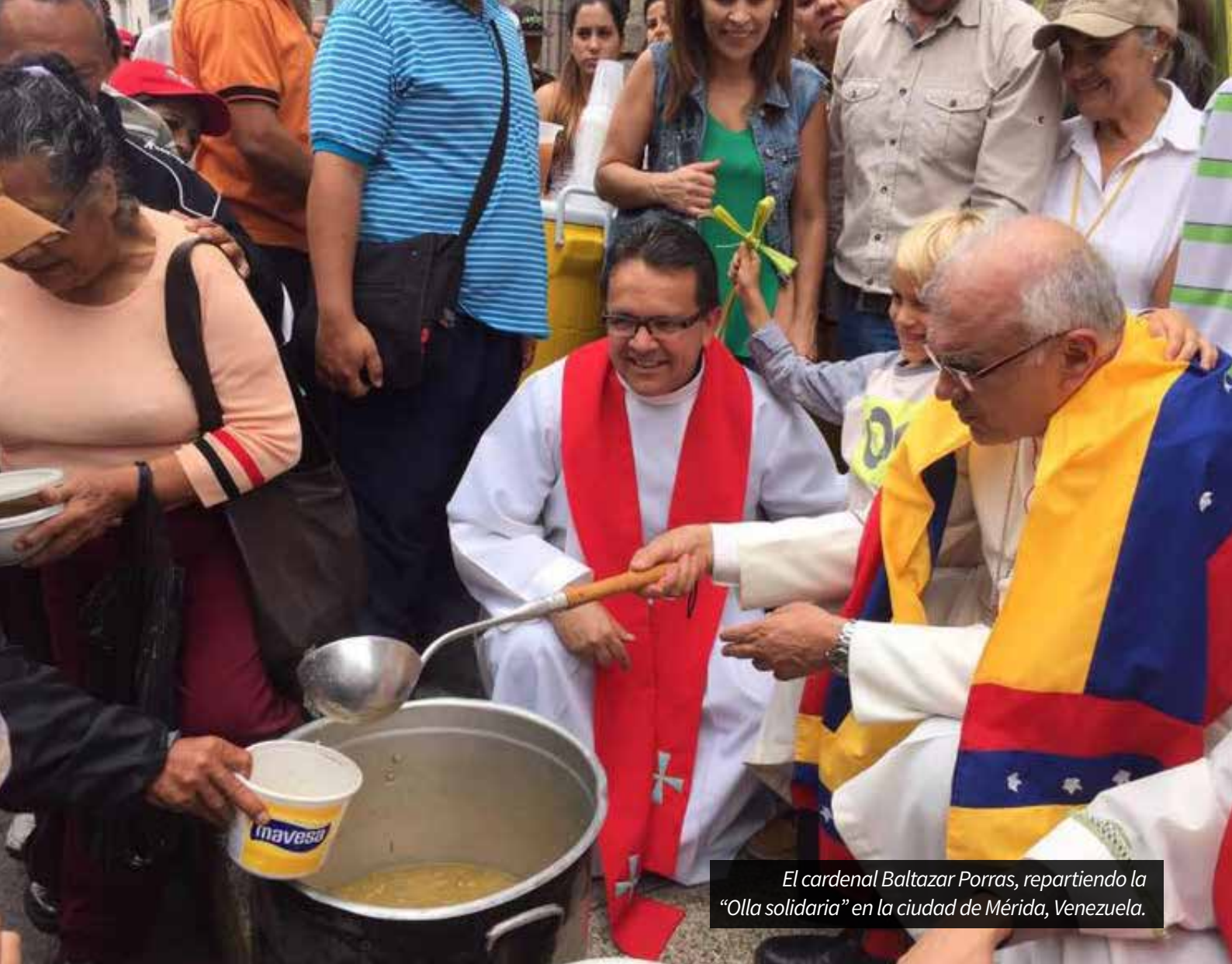
El cardenal Baltazar Porras, repartiendo la "Olla solidaria" en la ciudad de Mérida, Venezuela.