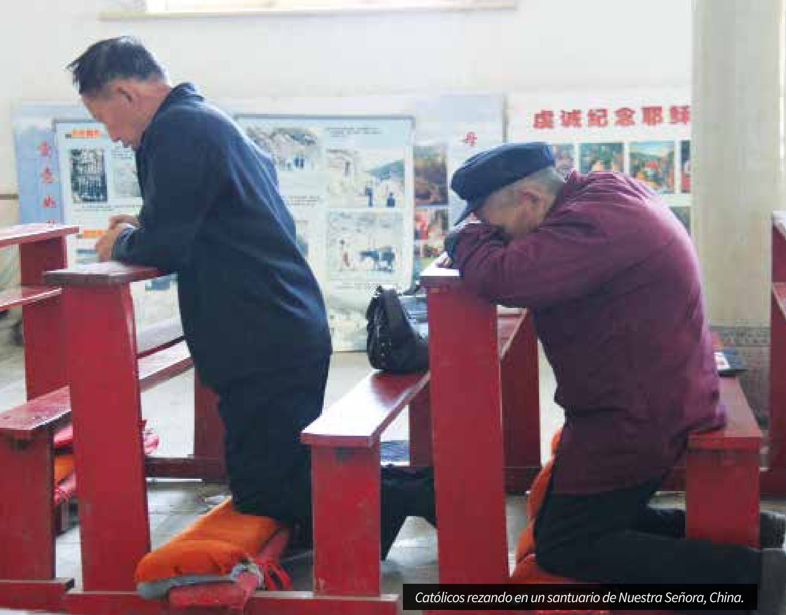
Católicos rezando en un santuario de Nuestra Señora, China.