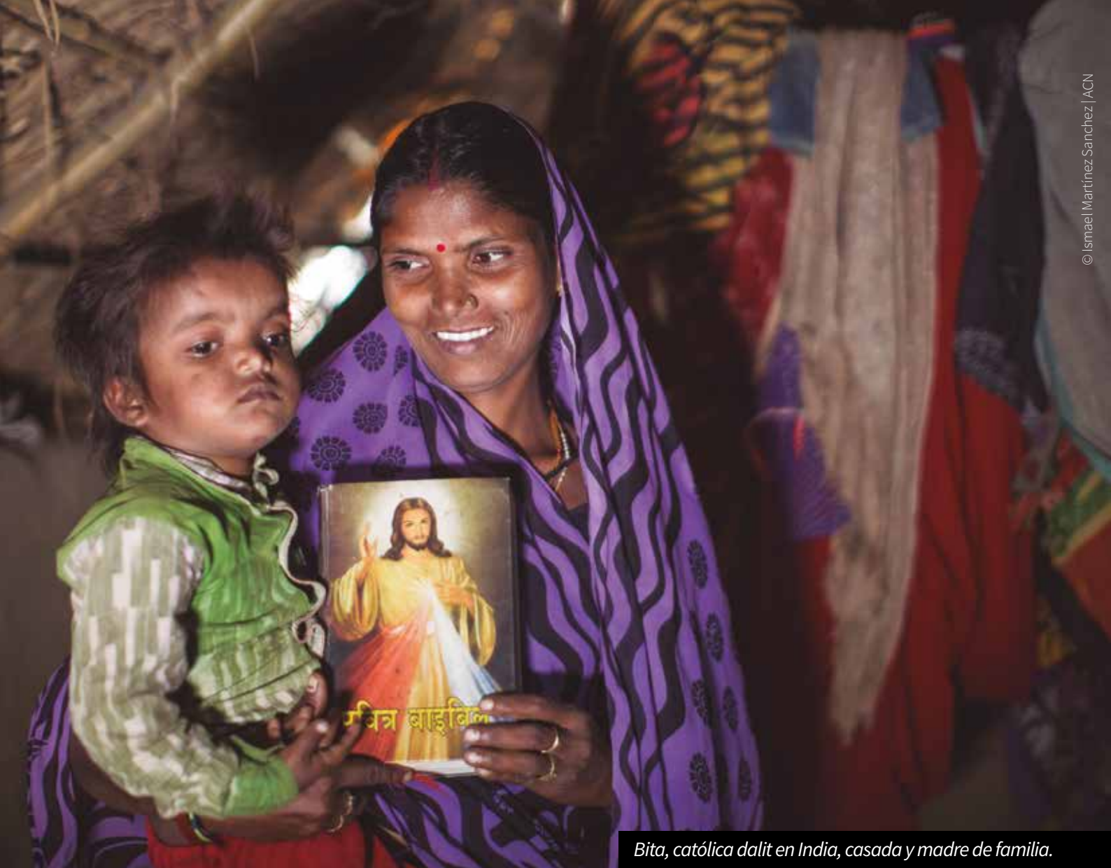
Bitá, católica dalit en India, casada y madre de familia.