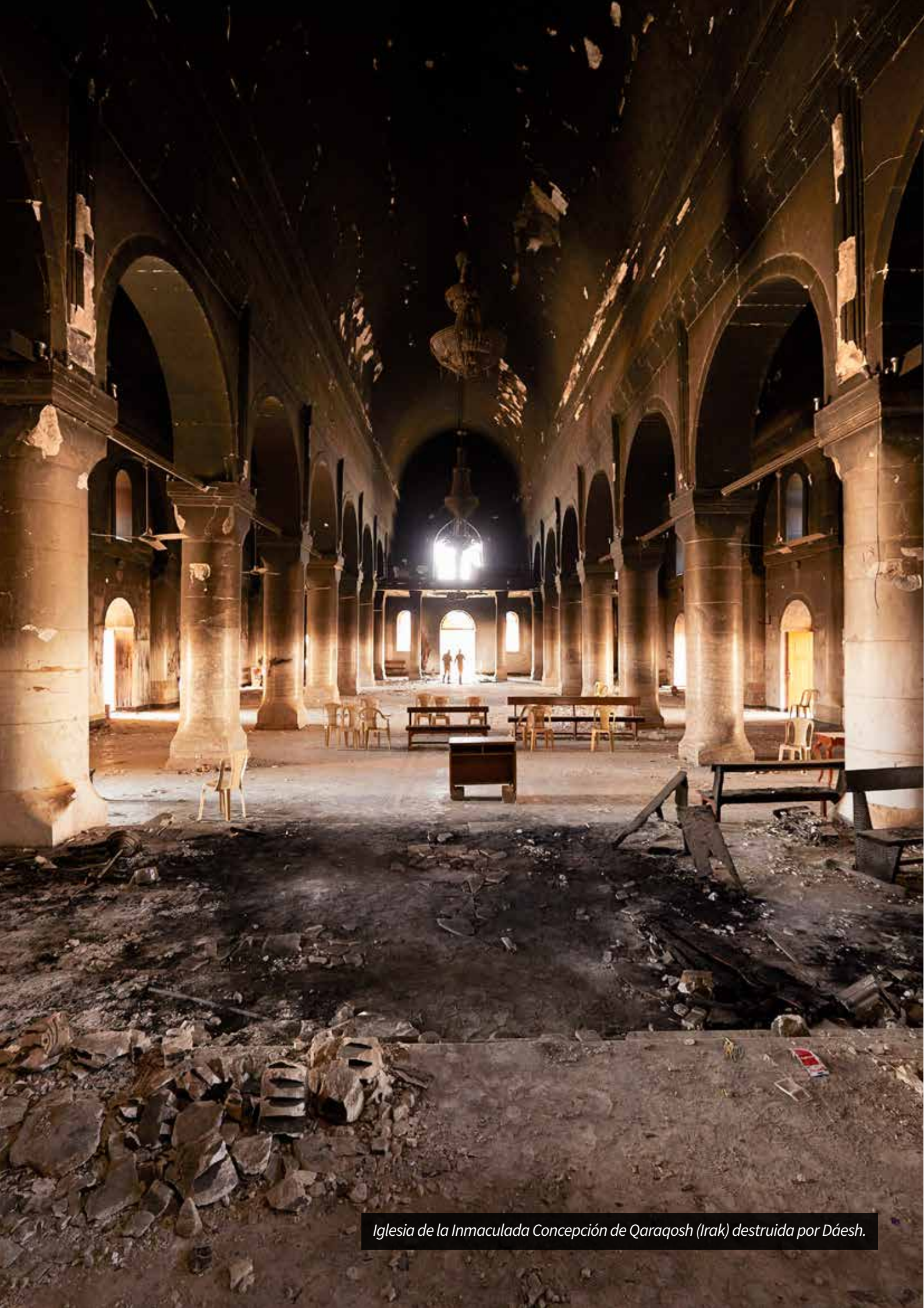
Iglesia de la Inmaculada Concepción de Qaraqosh (Irak) destruida por Dáesh.