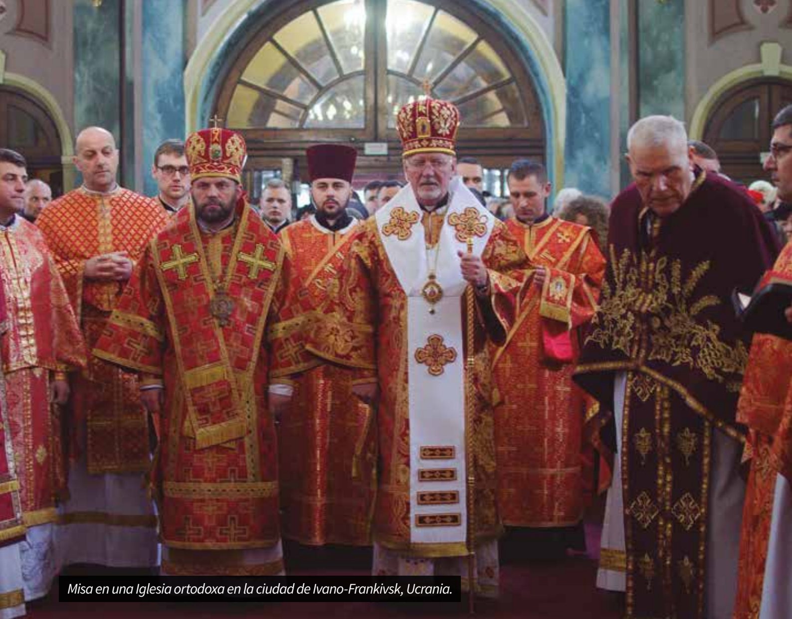
Misa en una Iglesia ortodoxa en la ciudad de Ivano-Frankivsk, Ucrania.