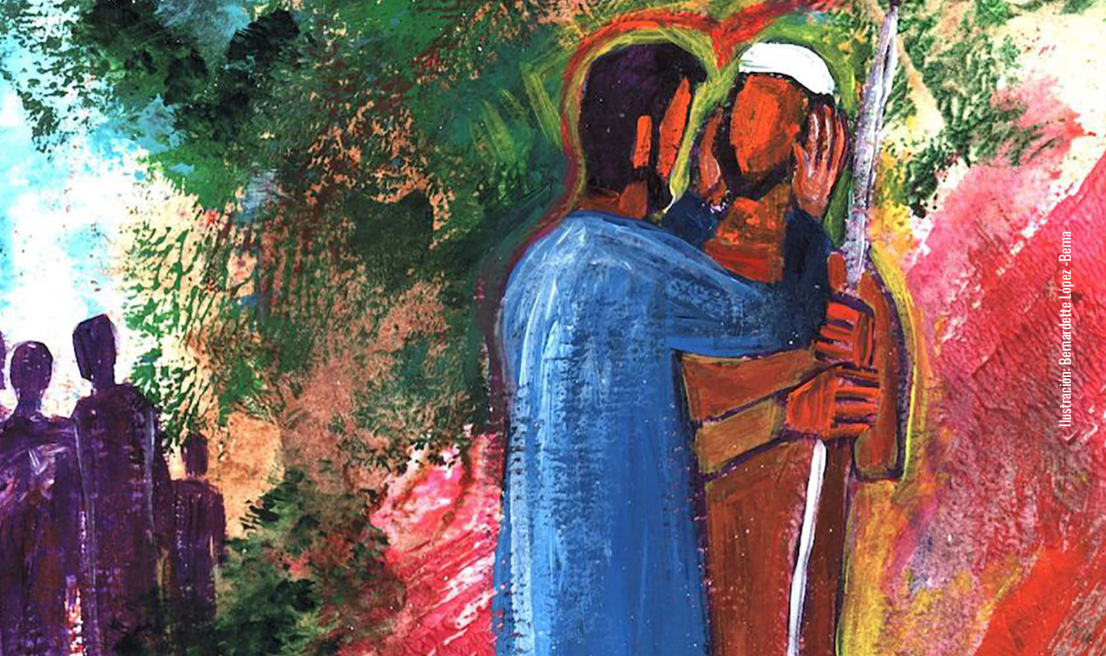
Ilustración: Bernardette López-Berna