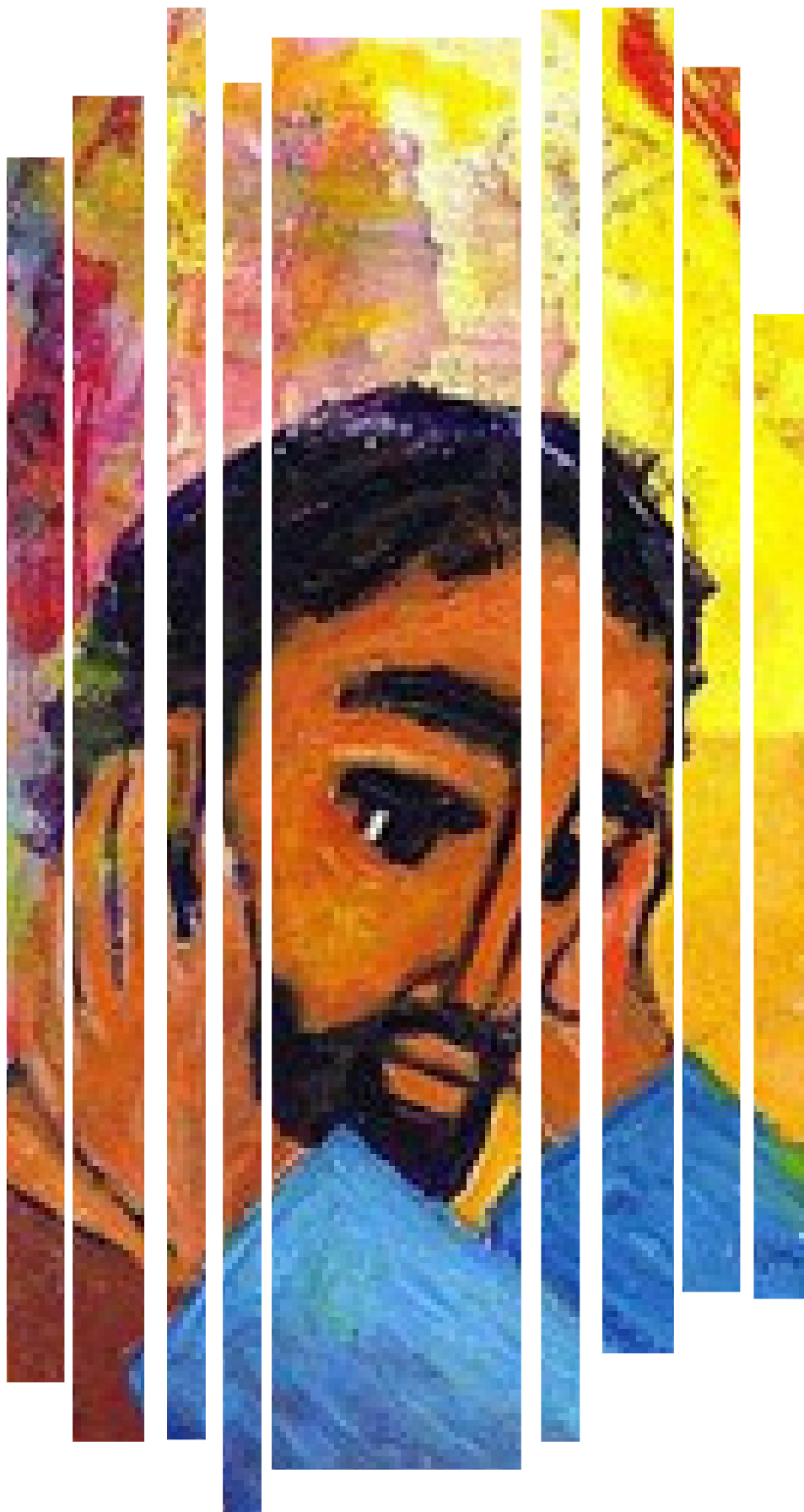
Ilustración: Bernardette López - Bema-

«Y mirando al cielo, suspiró y le dijo: Effetá (esto es, "ábrete")» Mc 7,14