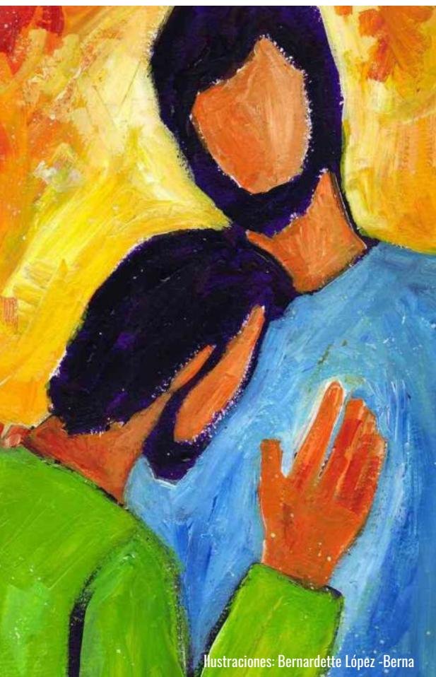
Ilustraciones: Bernardette López - Berna

Pero Jesús no es un curandero. Las palabras centrales del texto son las que siguen: “Y mirando al cielo, suspiró y le dijo: effetá (esto es, “que seas abierto”)” . Es el gesto del Hijo que eleva los ojos al Padre que todo lo puede con su poder y misericordia y le suplica que abra los ojos del hombre y desate su lengua para que sea de nuevo hijo de Dios y hermano de todos. El effetá no es principalmente un grito al sordomudo para que se abra, sino al Padre para que abra la vida entera del hombre, herido por el pecado, y lo conduzca a la escucha y la comunicación. Effetá es un “pasivo divino” (“sé abierto”); es una oración al Padre (J. Markus), para que él actúe en la humanidad sorda y muda. El milagro no sucede por magia, sino por oración filial de Jesús al Padre, y es éste quien lo realiza a través del Hijo.