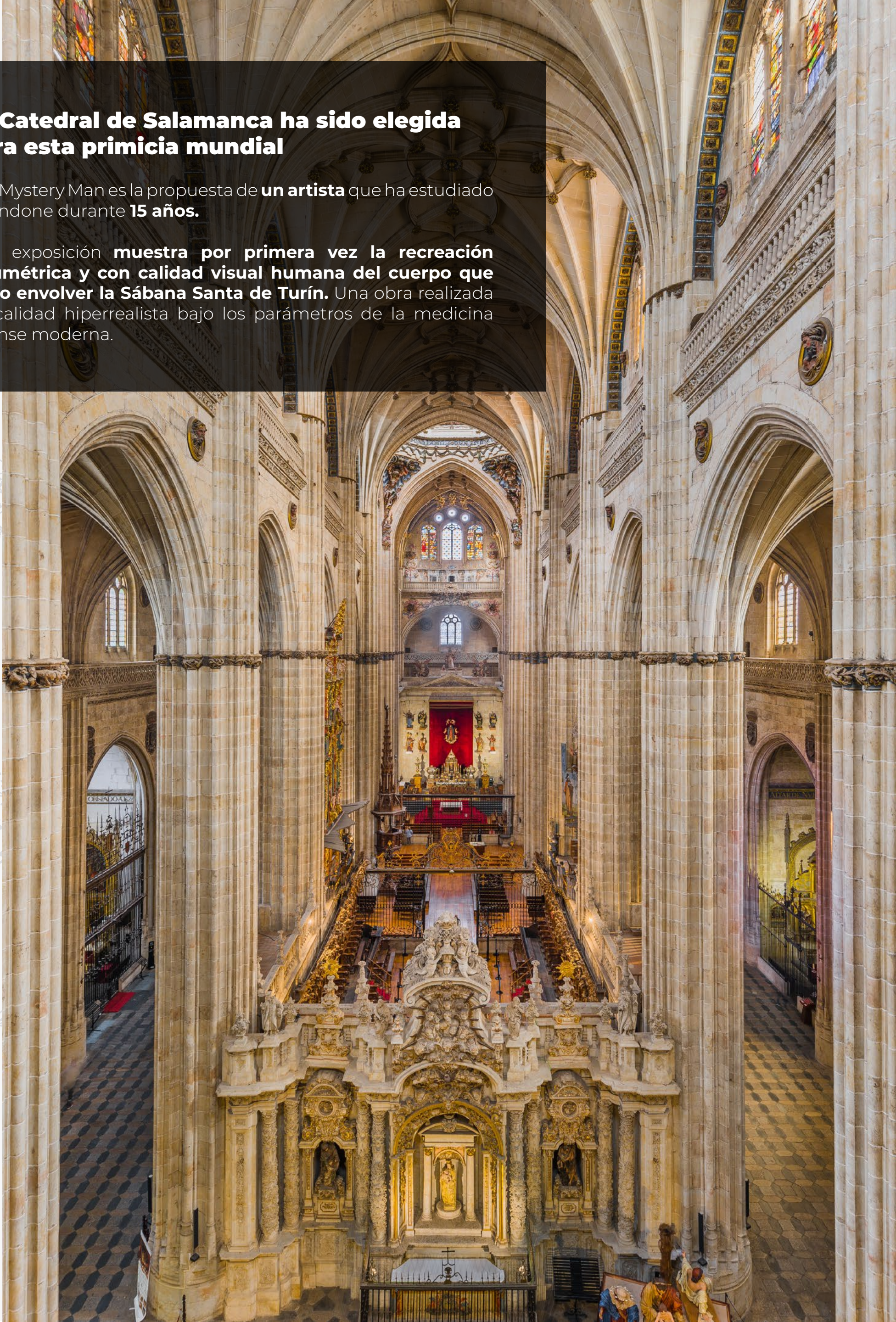
Nave central. Catedral Nueva de Salamanca

Esta exposición muestra por primera vez la recreación volumétrica y con calidad visual humana del cuerpo que pudo envolver la Sábana Santa de Turín . Una obra realizada en calidad hiperrealista bajo los parámetros de la medicina forense moderna.