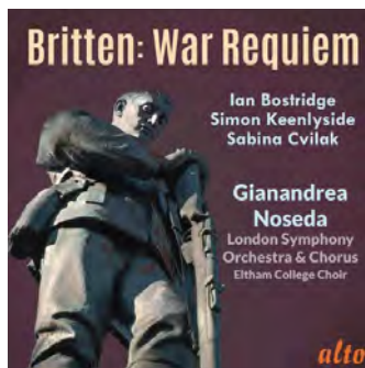
BRITTEN: War Requiem