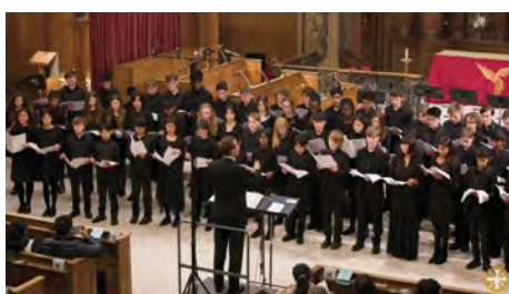
Eltham College Choir - Verleih uns Frieden - Felix Mendelssohn