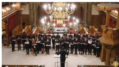
Chamber Choir - Valiant for Truth - Ralph Vaughn Williams