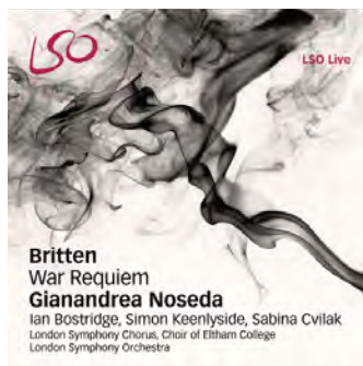
BRITTEN: War Requiem