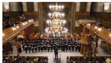
Eltham College Choir - Blessed be the God and Father - Samuel Sebastian Wesley