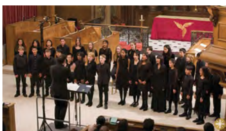
Eltham College Young Voices - Call of Wisdom - Will Todd