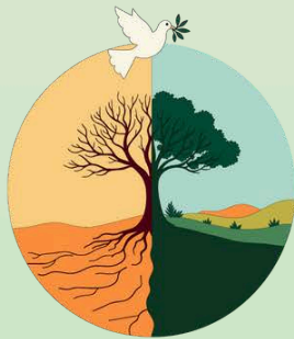
Jardín de la Paz Isaías 32:14-18