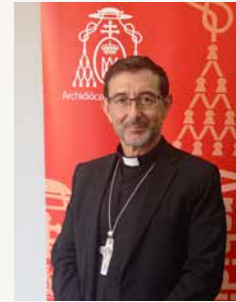
MONS. JOSÉ COBO Cardenal Arzobispo de Madrid

Después de una pesca milagrosa, Jesús entabla con Pedro el diálogo que acabamos de escuchar. Un diálogo que no quedó encerrado en aquel momento, junto al lago de Galilea, sino que, desde entonces, resuena en cada generación y llega hasta nosotros. Hoy es Pedro, en la persona de León XIV, quien vuelve a invitarnos a entrar en ese coloquio. La visita del Papa, por tanto, nos ofrece la oportunidad de volver a escuchar la pregunta de Jesús: ¿Me amas? Pregunta que resuena hoy en nuestras familias, en nuestras casas, en nuestra vida cotidiana. Y pregunta que también nos da la oportunidad de poder responderle, personal y comunitariamente, desde lo más profundo del corazón: «Tú sabes que te quiero». Recibiremos al Papa en medio de una situación social y mundial compleja. En sus palabras, resonarán las que Jesús resucitado les dijo a los Apóstoles en el cenáculo: «Paz a vosotros». Escuchar este saludo será un alivio, porque la paz viene de Dios como un don; y también será una tarea que deberemos acometer con responsabilidad.